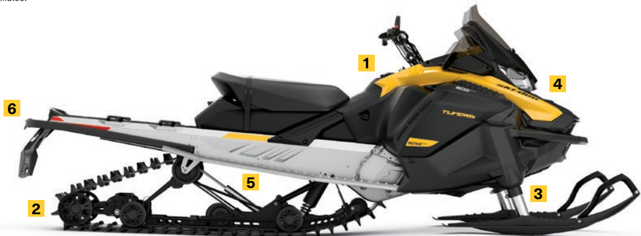
TUNDRA MC LT 600 EFI MONTRE

Flottaison et traction supplémentaires lorsque la neige est profonde.