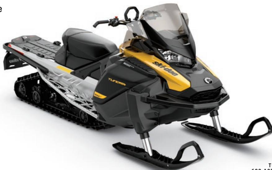
TUNDRA MC LT 600 ACE MC MONTRÉ

Excellentes performances hors-piste et dans la neige profonde, avec capacités utilitaires.