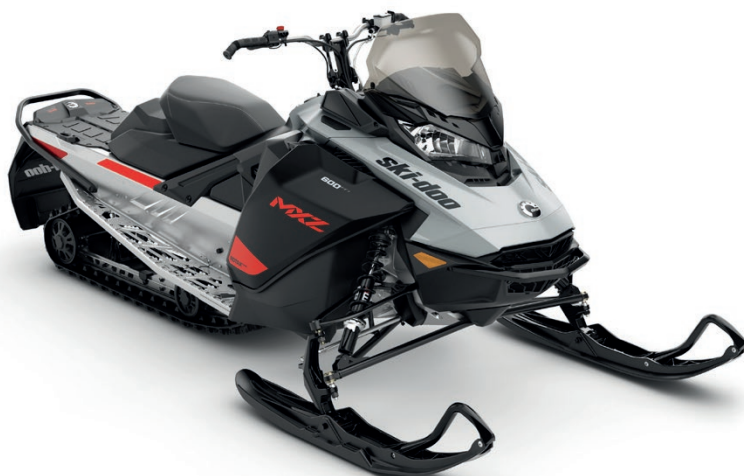
MXZ® SPORT 600 EFI VISAS

Dynamiska Led-prestanda och värdeorienterade funktioner.