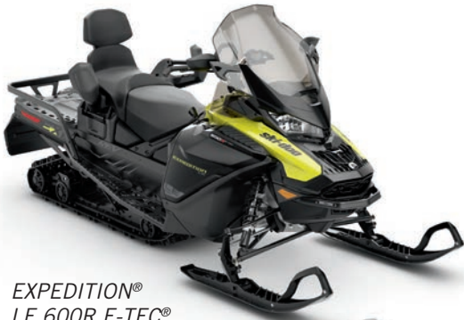
EXPEDITION® LE 600R E-TEC® montré