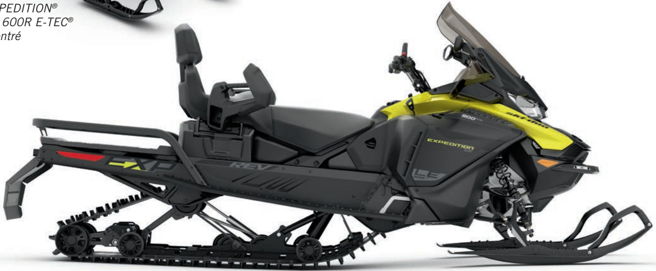
EXPEDITION® LE 900 ACE MC montré