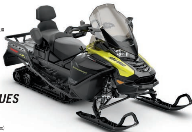
EXPEDITION® LE 900 ACE MC TURBO montré