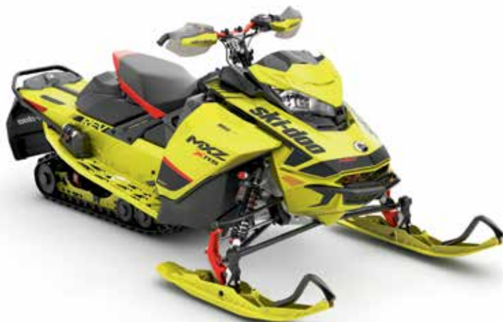
MXZ® X-RS® 850 E-TEC® montré