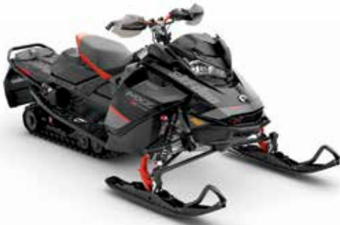
MXZ® X-RS® 600R E-TEC® montré