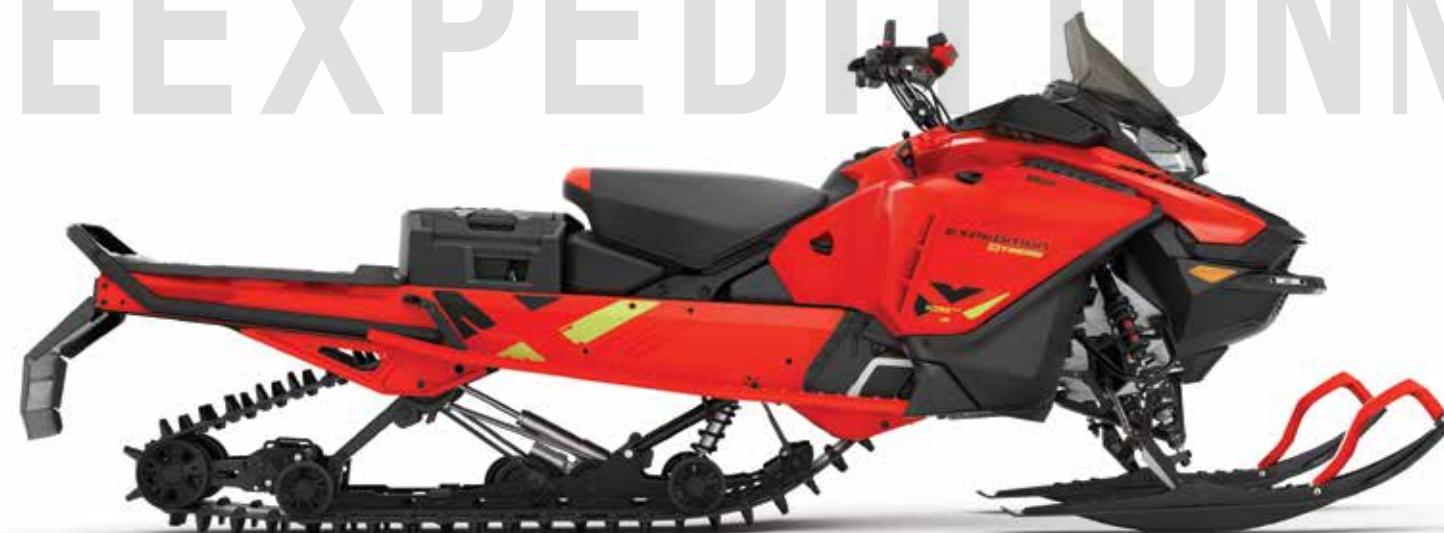
EXPEDITION ® XTREME 850 E-TEC MONTRÉ