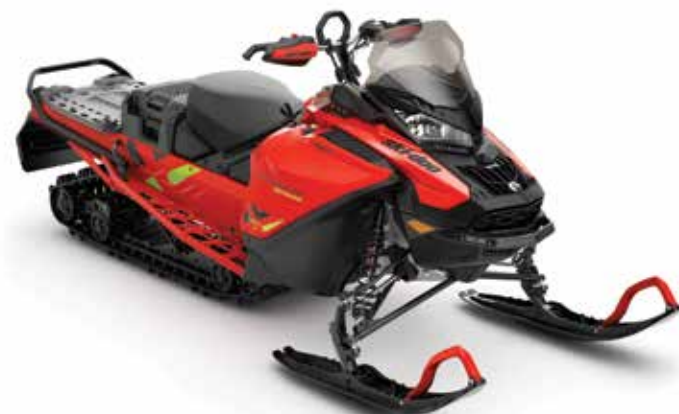
EXPEDITION ® XTREME 850 E-TEC MONTRÉ