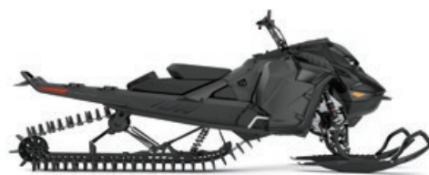
SUMMIT EDGE 165 850 E-TEC MONTRÉ

Cet ensemble haut de gamme est offert en saison, entièrement équipé de caractéristiques techniques éprouvées.