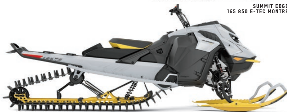
SUMMIT EDGE 165 850 E-TEC MONTRÉ