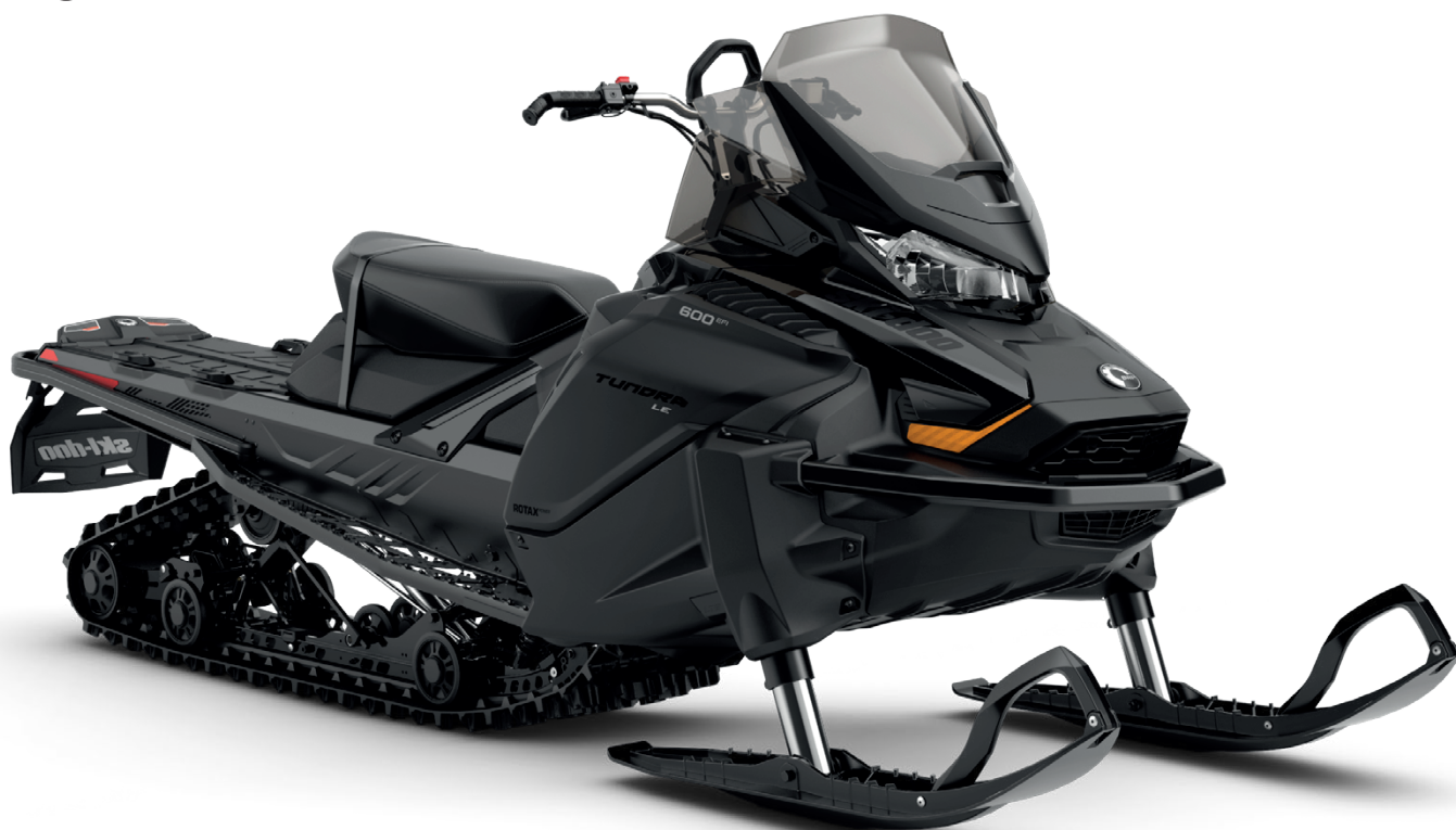
TUNDRA LE 600 EFI VIST