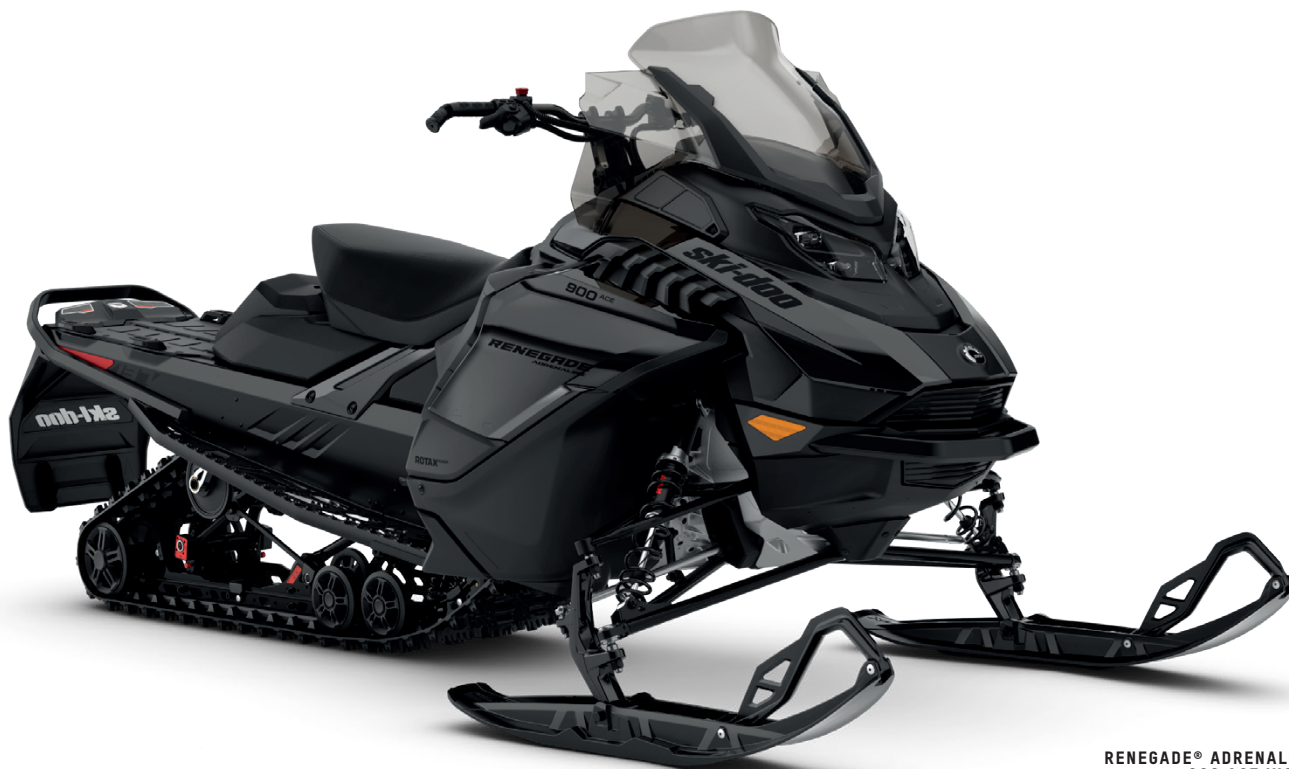
RENEGADE® ADRENALINE 900 ACE VISAS