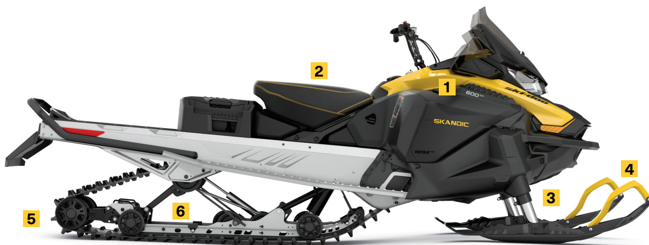
SKANDIC SPORT 600 EFI MONTRE

Suspension avant télescopique, exclusive dans l'industrie, permettant à la large coque de procurer une flottaison exceptionnelle dans la neige profonde.