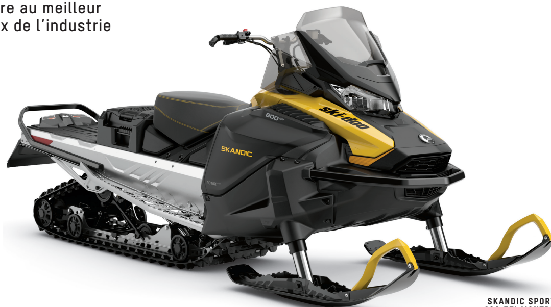
SKANDIC SPORT 600 EFI MONTRE

Le véhicule utilitaire au meilleur rapport qualité-prix de l'industrie de la motoneige.