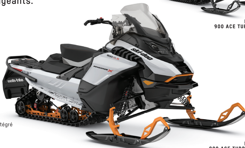
RENEGADE X 900 ACE TURBO R MONTRE