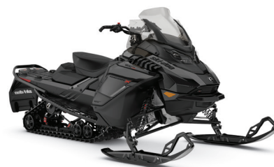
RENEGADE X 900 ACE TURBO MONTRE

Des caractéristiques de haute performance et de haute technologie pour les motoneigistes les plus exigeants.