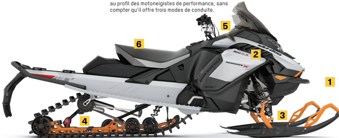
RENEGADE X 900 ACE TURBO R MONTRE

Amortisseurs HPG Plus à l'avant et au centre. Amortisseur arrière KYB Pro 36 avec ajustement de la vitesse de compression à l'aide d'un simple bouton. Quatre amortisseurs démontables en aluminium.