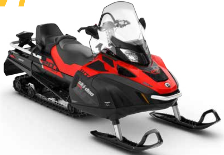
Kuvassa SKANDIC® WT 900 ACE™