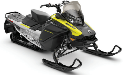
RENEGADE® SPORT 600 ACE™ KUVASSA