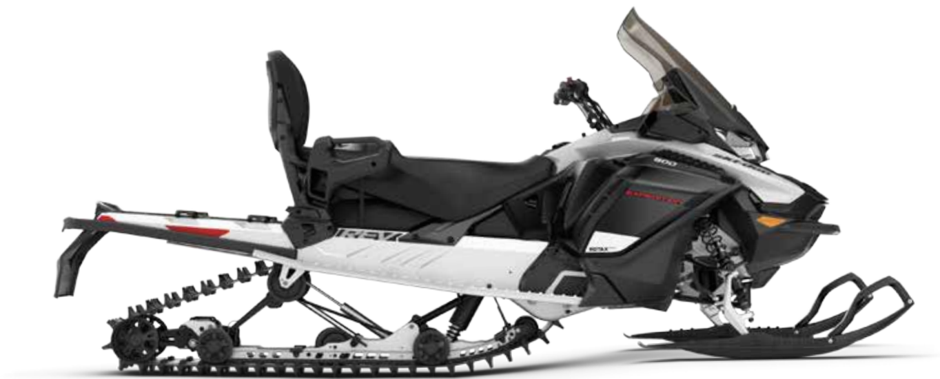
EXPEDITION® SPORT 900 ACE™ på bilden