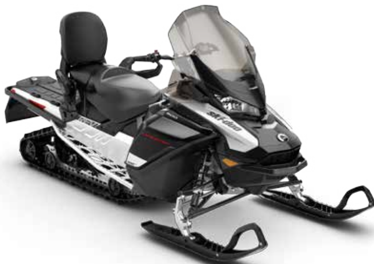
EXPEDITION® SPORT 900 ACE™ på bilden