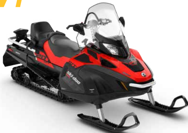
SKANDIC® WT 900 ACE™ på bilden