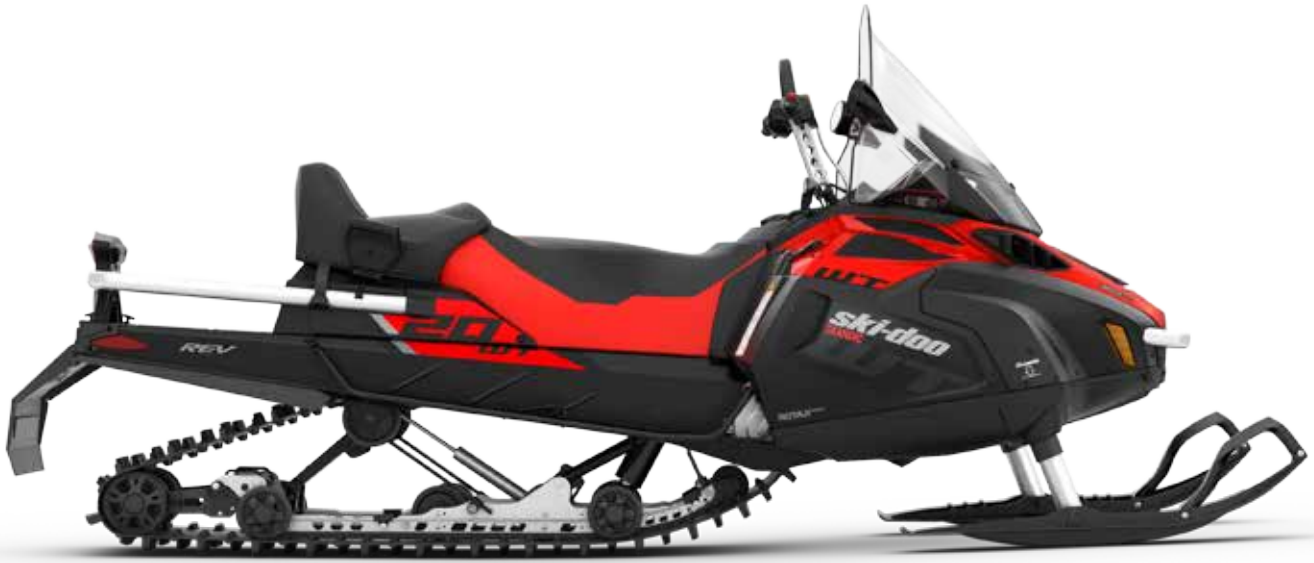
SKANDIC® WT 900 ACE™ på bilden