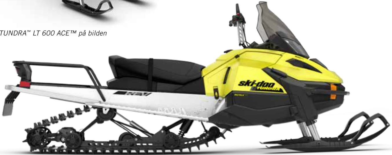
TUNDRA™ LT 600 ACE™ på bilden