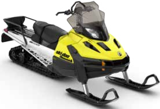
TUNDRA™ LT 600 ACE™ på bilden