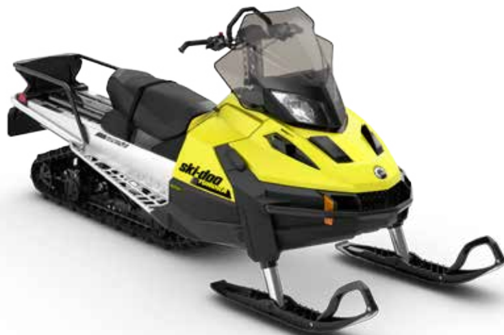
TUNDRA™ LT 600 ACE™ på bilden