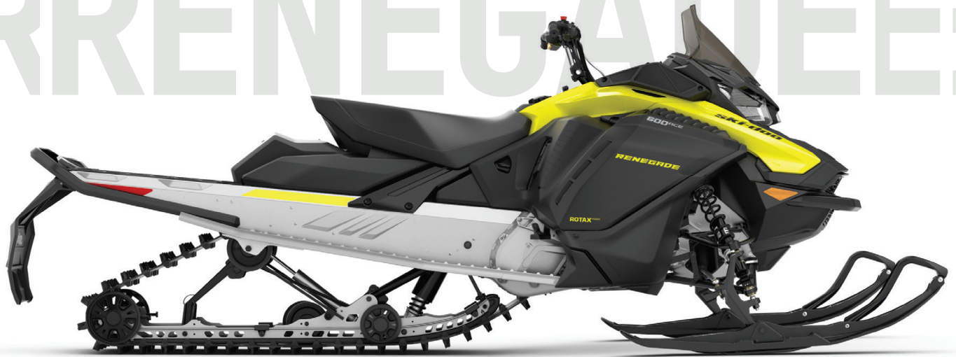
RENEGADE® SPORT 600 ACE™ VISAS