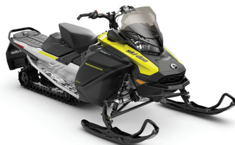
RENEGADE® SPORT 600 ACE™ VISAS