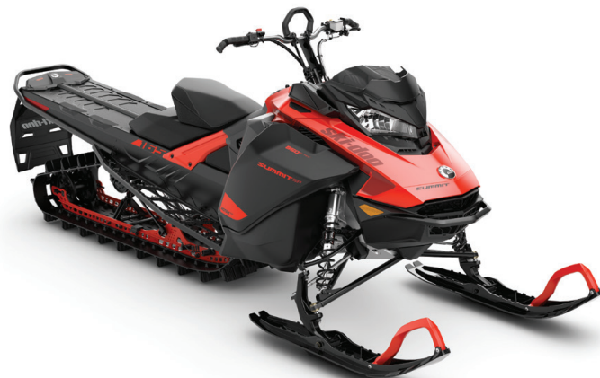
SUMMIT® SP 165 850 E-TEC® VISAS